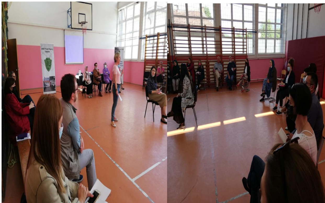
“Empatijski zamor” tema je treće radionice za školsko osoblje održane dana, 2.6.2021. godine. Cilj ove aktivnosti je bio prepoznati sindrom profesionalnog sagorijevanja kod pomagačkih struka kao i prevenciju pojave sindroma.