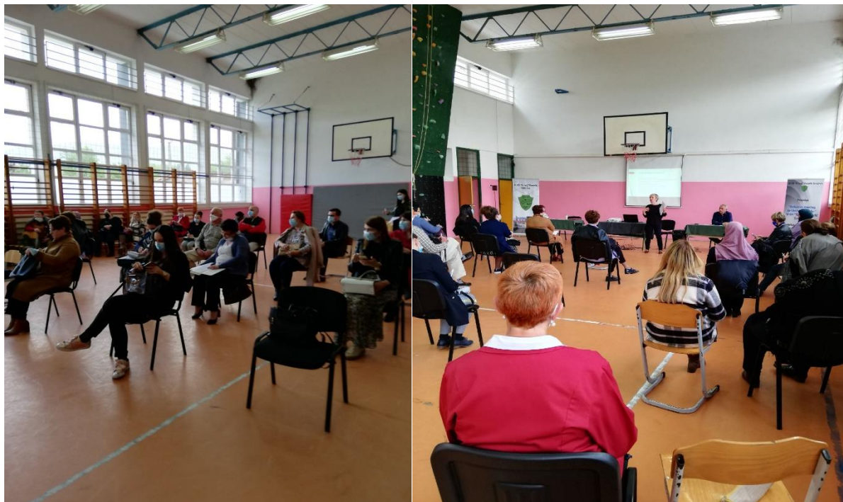
Prva radionica za školsko osoblje JU OŠ "9.maj" Pazarić, Sarajevo "Kako da brinemo o sebi?"

Dana, 27.5.2021. godine u školi je održana druga radionica "Vježba eksternalizacije izazova, problema i neugodnih emocija". Aktivnost je urađena kao iskustvena i interaktivna vježba s ciljem suočavanja i učenja kako napraviti otklon i kako preuzeti kontrolu nad izazovima, problemima i/ili neugodnim emocijama povezanim sa radnim poslovima i radnim okruženjem.